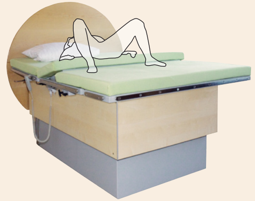
Beckenklappe zur Steißanhebung 0–23° Höhenverstellung 63–91 cm