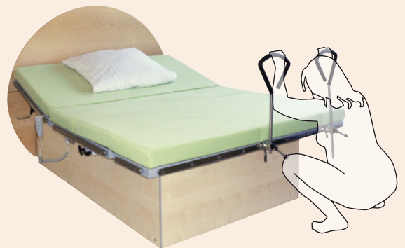
Tiefe Hocke am Bett mit Haltegriffen