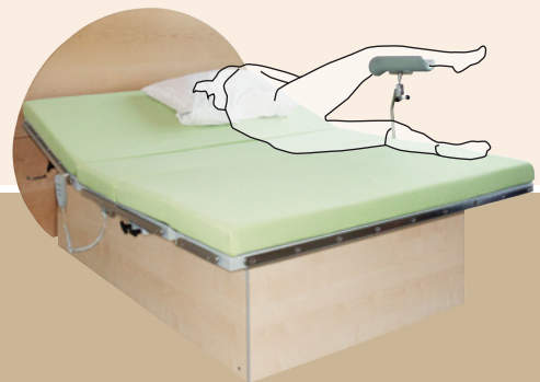
Seitenlage umlaufende Normschienen für Zubehör