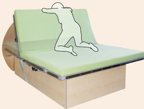
Vierfüßlerstand Kopfteil elektrisch verstellbar 0–68°