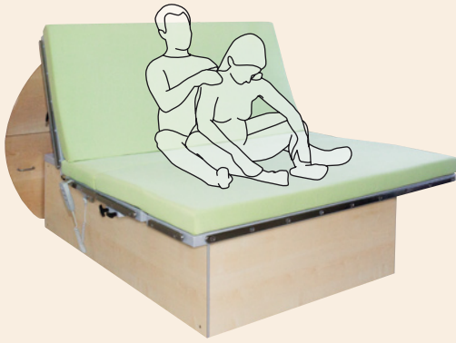
Partnermassage hochgestelltes Kopfteil